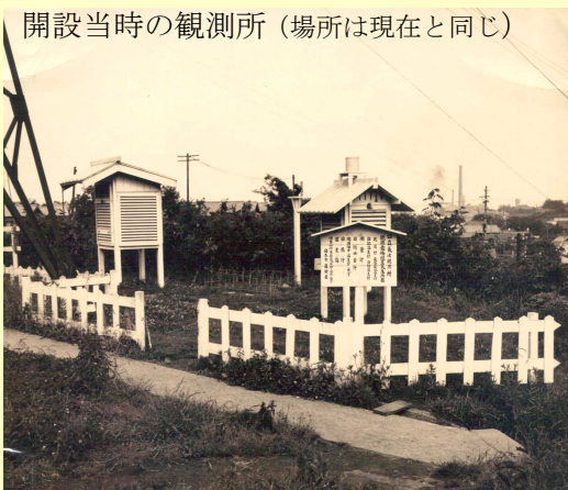
開設当時の観測所(場所は現在と同じ)

昭和27年6月に誕生した日立市天気相談所ですが、実際の業務は順次はじまっていきました。日立鉱山から引き継いだ、神峰山観測所は、鉱山時代から勤務していた方にお願いくことで、6月15日から観測がはじまりました。日立市役所にも、新たに観測所を設置し、9月から観測が開始されました。当時の観測場所は、現在と同じ位置で、市役所北側の市営諏訪台団地の前にあります。火災監視のためにもうけられていた望楼があり、その下に百葉箱等を設置しました。観測は、現在とほぼ同じ項目を行っており、気温については、観測場所の移動もありません。